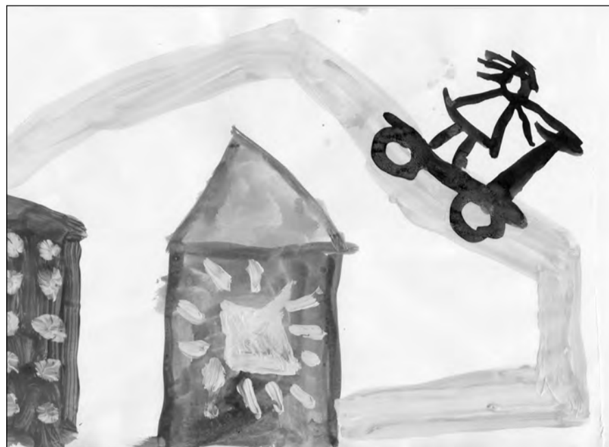
Маша Данилова, 5 лет.