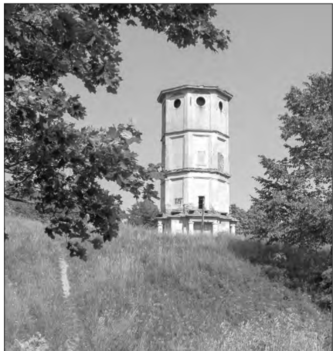
Водокачка в Приоратском парке: «Мы, конечно, будем рассматривать развитие этой территории.»

- Да, интересные авторские экскурсии мы, конечно, берем на вооружение. Дело в том, что туристы сейчас очень избирательны. Да и мы с вами, когда едем куда-либо отдохнуть, хотим чего-нибудь эдакого, а не просто посмотреть стандартные достопримечательности. Также большое количество людей предпочитают самостоятельно планировать свое путешествие. Поэтому под каждую группу, семью, посетителя формируется свой пакет.