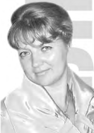
Учитель русского языка и литературы.

Если сотрудник с гордостью рассказывает своим друзьям, где он работает — вот он, успех. Значит, знает, «что все это не напрасно», как писал известный поэт в свое время.