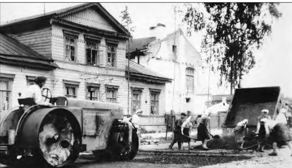
пр. 25 Октября. Дом на месте нынешнего здания ВТБ 24. 1948 г.