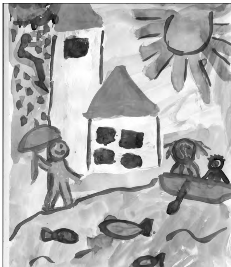
Саша Кейер, 5 лет.

Но братик не слышит, Он счастлив, он спит.