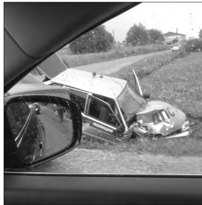
Информацию по Гатчинскому району подготовил: А. ЛАПЕНКОВ, КОМАНДИР ВЗВОДА ОР ДПС ГИБДД УМВД РОССИИ ПО ГАТЧИНСКОМУ Р-НУ.

Гатчинский Отдел ГИБДД предупреждает, причиной всех аварий становится неаккуратность и невнимательность всех групп участников дорожного движения. Соблюдайте правила — берегите себя!