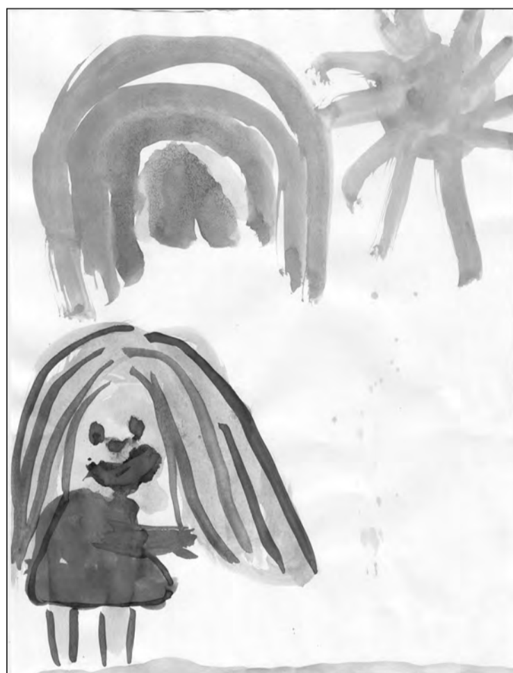
Ксюша Кириллова, 5 лет.