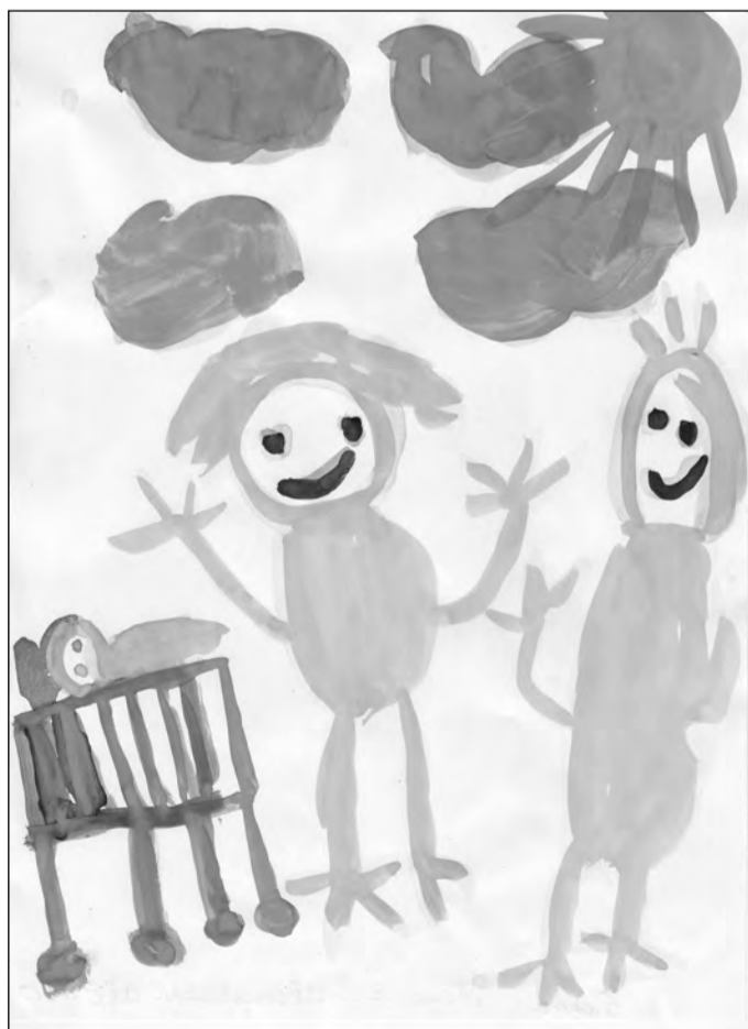
Полина Максименкова, 5 лет.